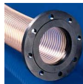
Kołnierz stały Combiflex