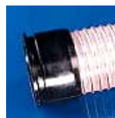
Kołnierz stożkowy Combiflex